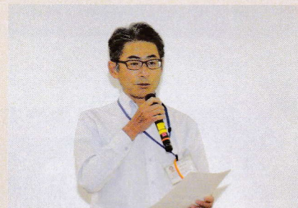
加持理事長ご挨拶